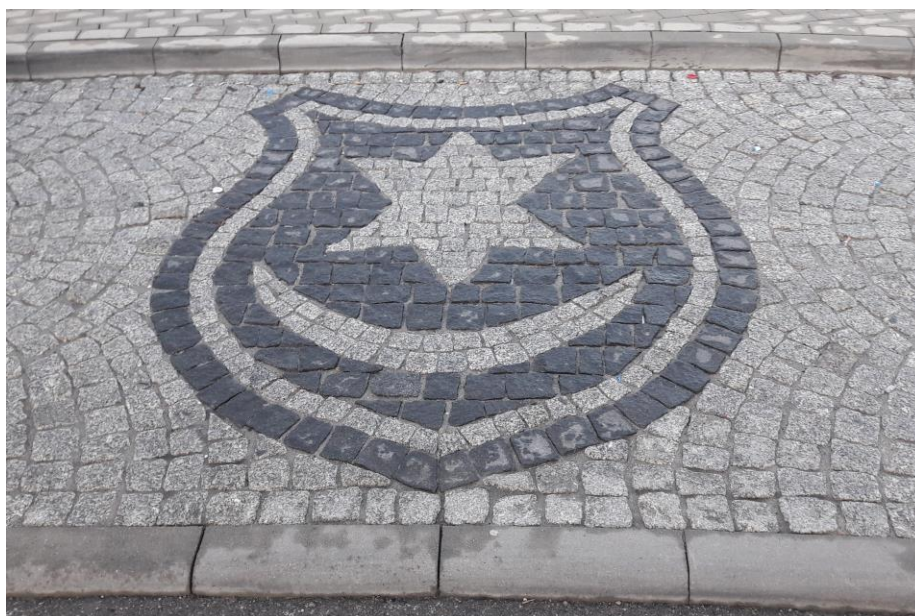
Herb Tarnowa wykonany z kostki brukowej w dwóch kolorach