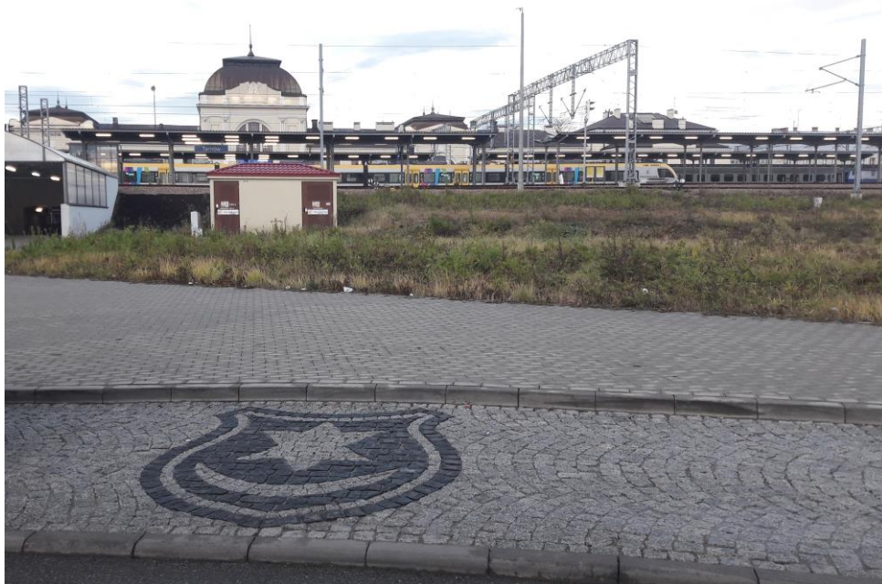
Miejsce: Tarnów Dworzec kolejowy PKP wyjście od strony południowej.

Tadeusz Kowalski SIMP Oddział Tarnów 33-100 Tarnów Tel. 647 258 257