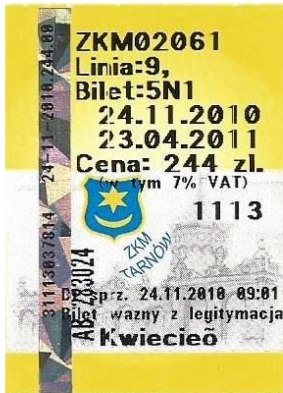
Zbiory prywatne: Bilet autobusowy komunikacji miejskiej