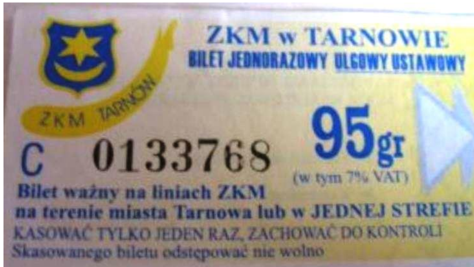
Bilet autobusowy komunikacji miejskiej